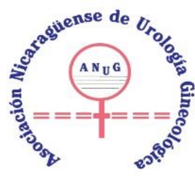
Asociación Nicaragüense de Urología Ginecológica