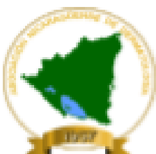
Asociación Nicaragüense de Dermatología