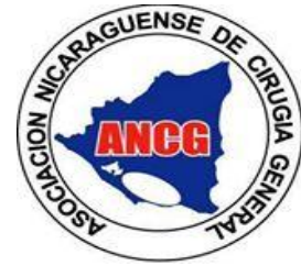
Asociación Nicaragüense de Cirugía General (ANCG)