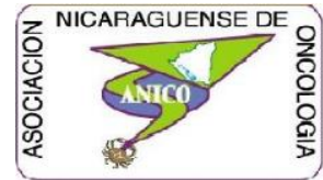
Asociación Nicaragüense de Oncología (ANICO)