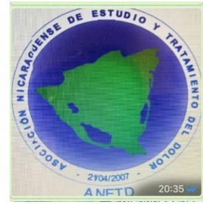
Asociación Nicaragüense de Estudio y Tratamiento del Dolor