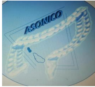
Asociación Nicaragüense de Coloproctología (ASONICO)