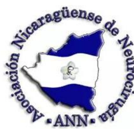
Asociación Nicaragüense de Neurocirugía