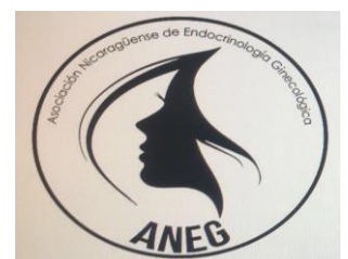
Asociación Nicaragüense de Endocrinología Ginecológica (ANEG)